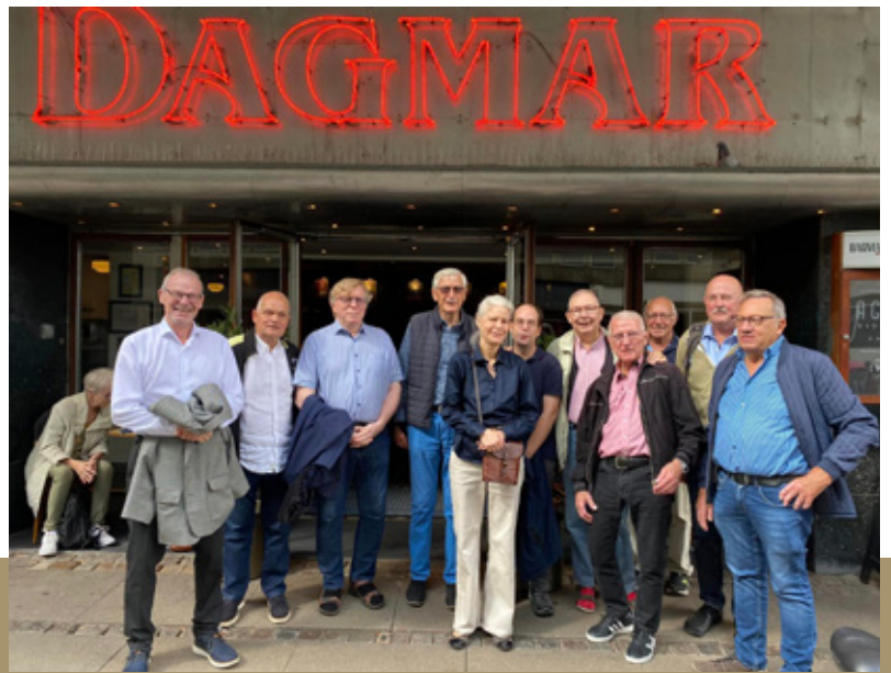
Siden begyndelsen af 2023 har mændene i Caritas' Herreklub hver anden mandag fra kl. 13 og nogle timer frem mødtes for at nyde et godt måltid mad og samles om en kulturel aktivitet. Det kan være et foredrag, et museumsbesøg eller – som her – en tur i biografen.

Caritas Samtale er en social indsats, der ikke findes i andre former rundt omkring i landet, og som dækker et stort behov hos målgruppen. Vi kan tillige se en stor søgning til indsatsen fra kommunale instanser og andre ngo'er, der henviser deres brugere til os.