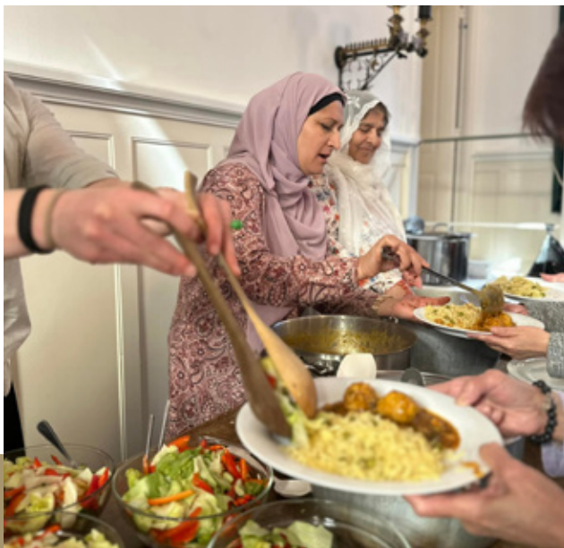
En gang om ugen mødes ældre i vores madfællesskab. De laver lækre retter af klimavenlige ingredienser og deler hverdagens glæder og sorger. En del af maden bliver leveret til kvinder og børn på et nærliggende krisecenter.