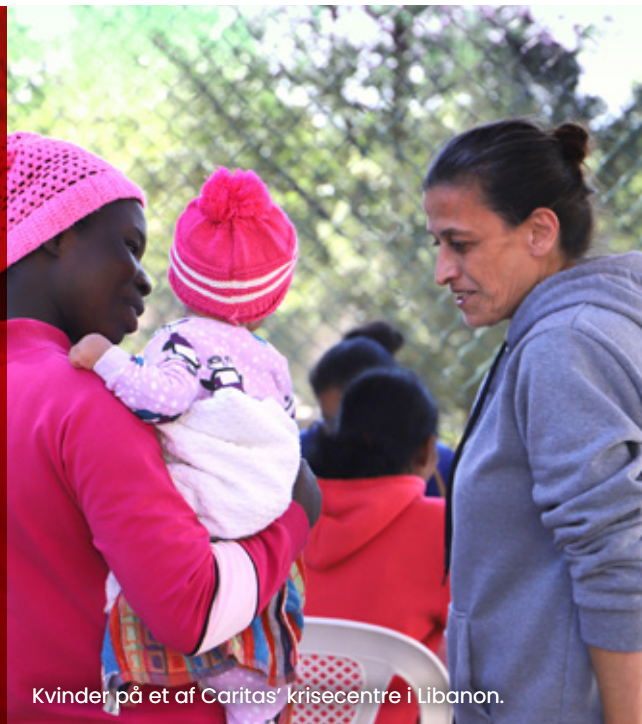
Kvinder på et af Caritas' krisecentre i Libanon.